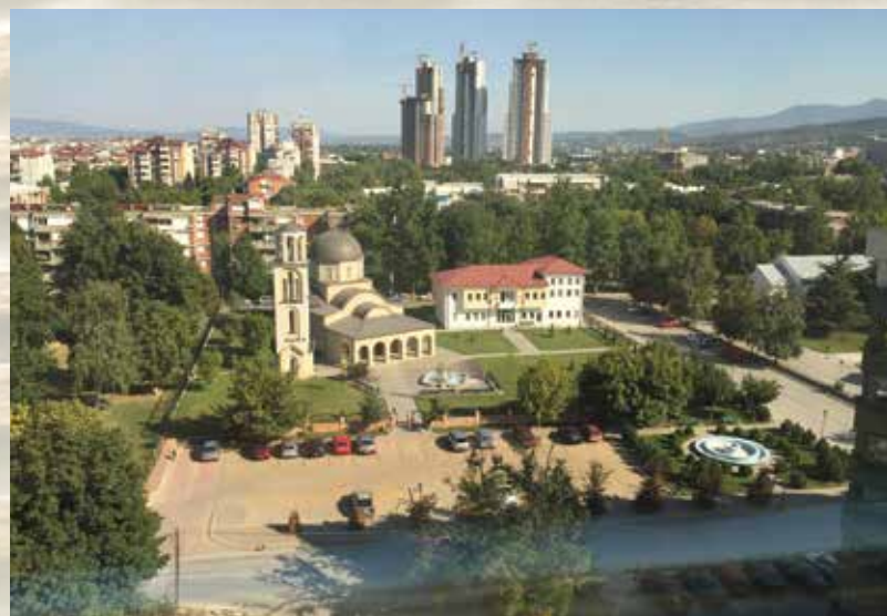
Свети Илија - Горан Јакимовски