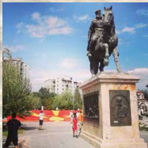
Празник - Филип Кокароски