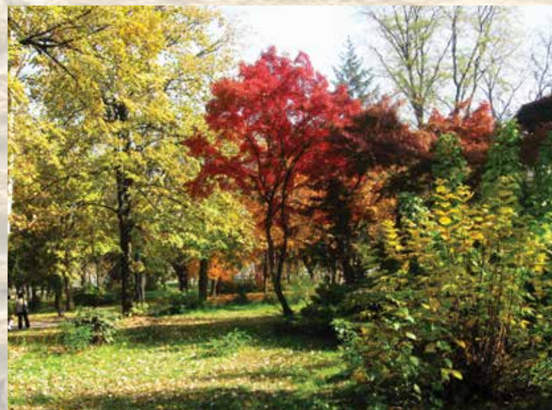
Бои на есента - Ксенија Тодорова

ПОКРАЈ ФОТОГРАФИЈАТА, ТРЕБА ДА СЕ НАВЕДЕ НАСЛОВОТ, ЛОКАЦИЈАТА И ИМЕТО НА АВТОРОТ.