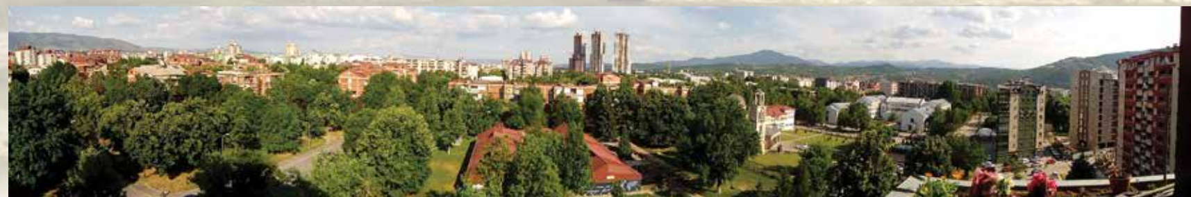
Панорама на Аеродром