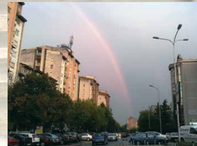
Суница - Љубица Манчевска